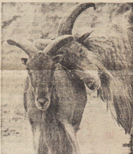
НА СНИМКАХ мирно соседствуют обитатели Менского зоопарка. Доверчиво тянутся они к своим дружным юннатам.